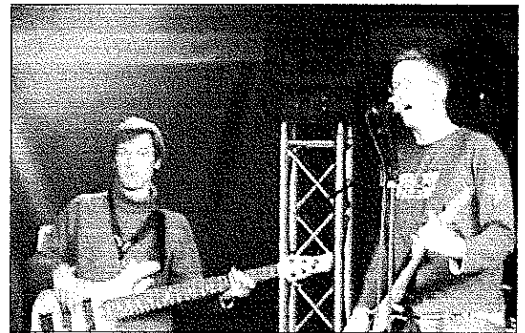
Jelly, un groupe qui monte en puissance, est à l'honneur sur Pure FM. Rendez-vous sur www.puredemo.be pour les soutenir. SULLY